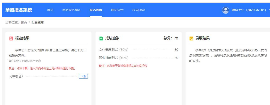
报名结果查询示例图