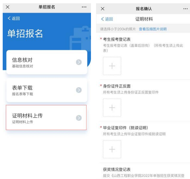
证明材料回传示例图