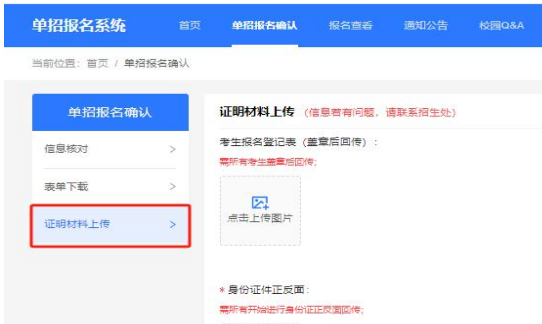
证明材料回传示例图