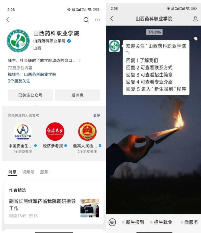
公众号入口示例图