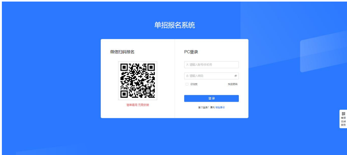
电脑 PC 端入口示例图

点击下方“核验身份”按要求使用“身份证号”、“考生号”等填写信息完成身份验证，注册成功后登录系统。 （后续若密码忘记，请点击“找回密码”通过短信验证方式重置密码。）