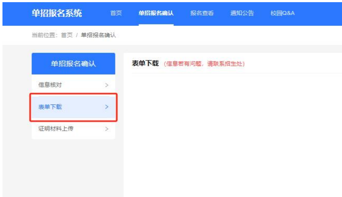
报名登记表等资料下载示例图

中等职业学校毕业（包括职业高中、普通中专、技工学校等）及同等学力考生无须下载。）