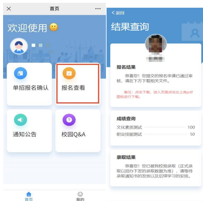
报名结果查询示例图