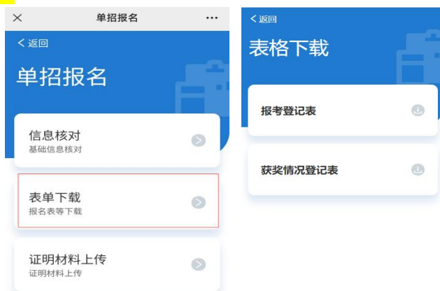
报名登记表等资料下载示例图

注：使用苹果手机的同学如下载后找不到文件，可用电脑从学院官网登录单招报名确认系统下载，也可直接在山西药科职业学院招生网下载中心下载。