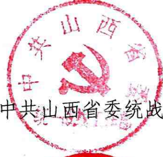
中共山西省委统战部