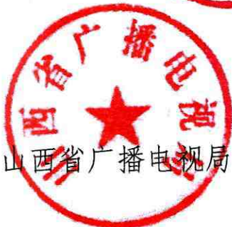
山西省广播电视局