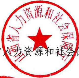
山西省人力资源和社会保障厅