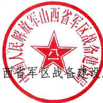
山西省军区战备建设局