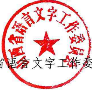
山西省语言文字工作委员会