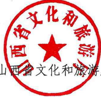
山西省文化和旅游厅