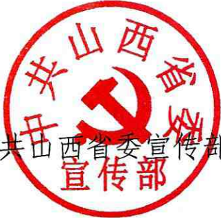
中共山西省委宣传部